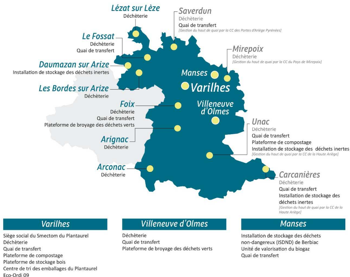
Figure 2 : Localisation des installations